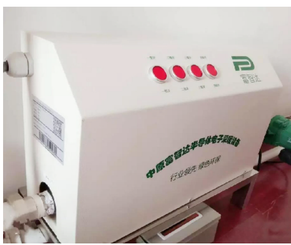
半导体电子采暖设备。