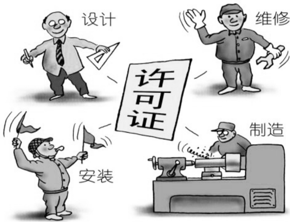
特种设备的设计、制造、安装、维修、改造,必须按照《特种设备安全监察条例》依法取得许可证后方可从事相关业务。 李祖飞 辑