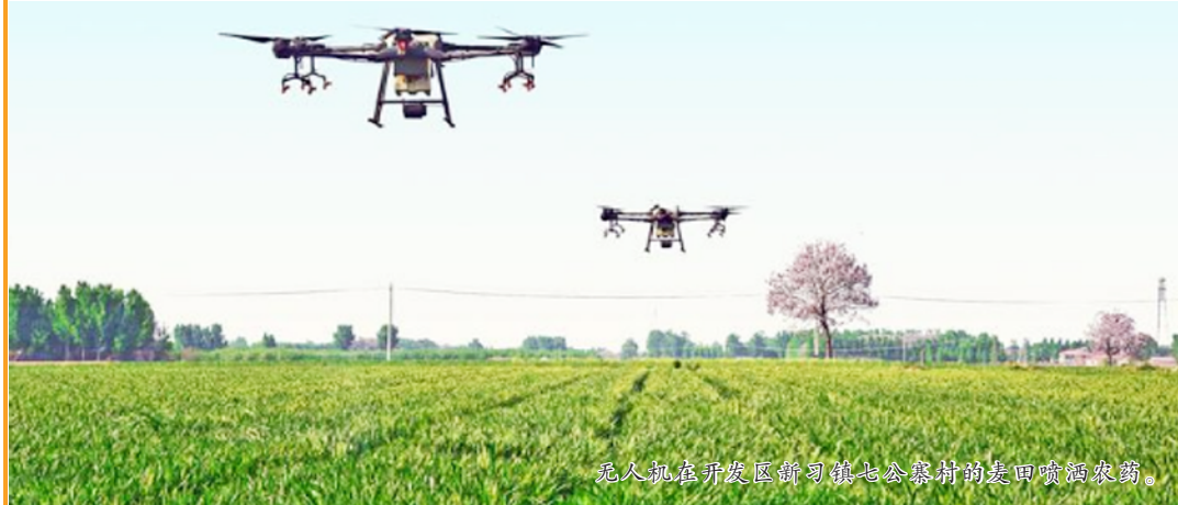
无人机在开发区新习镇七公寨村田间喷洒农药。