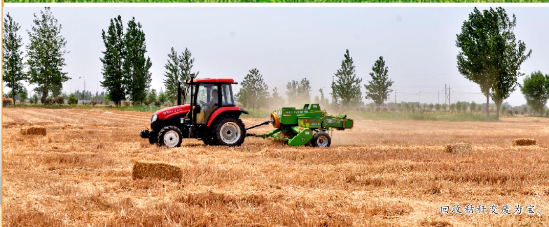
回收秸秆变废为宝。