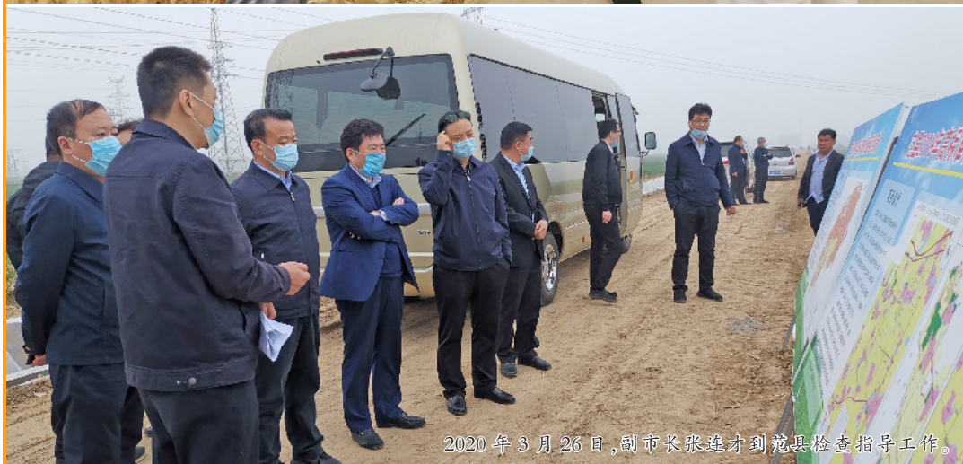
2020年3月26日,副市长张进才到范县检查指导工作。