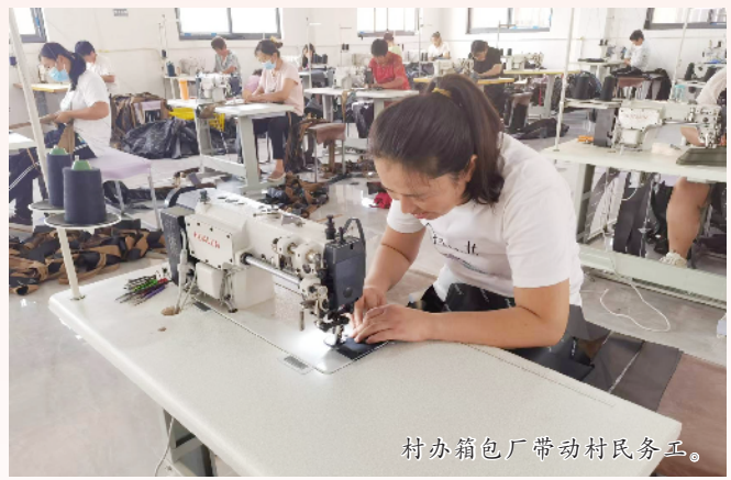
村办箱包厂带动村民务工。