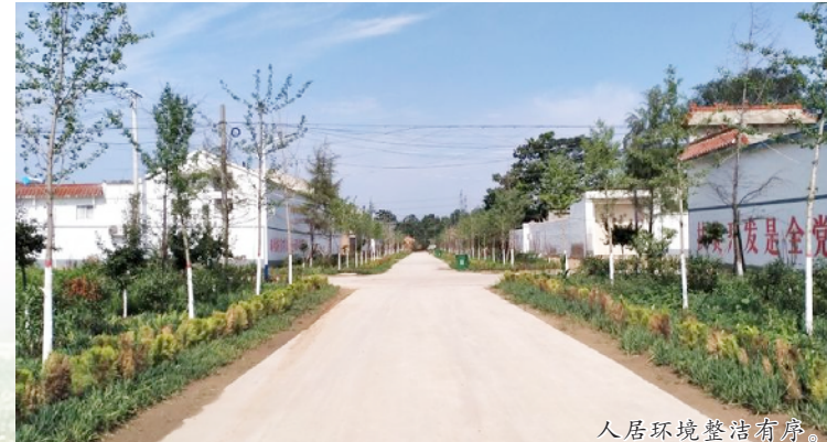
人居环境整治有章。

党的二十大报告指出,全面推进乡村振兴,全面建设社会主义现代化国家,最艰巨最繁重的任务仍然在农村。接下来,岳村镇将聚焦乡村振兴的总体目标要求,以“五星”支部创建为抓手,“穿针引线”勾勒出农业强、农村美、农民富的美丽画卷。