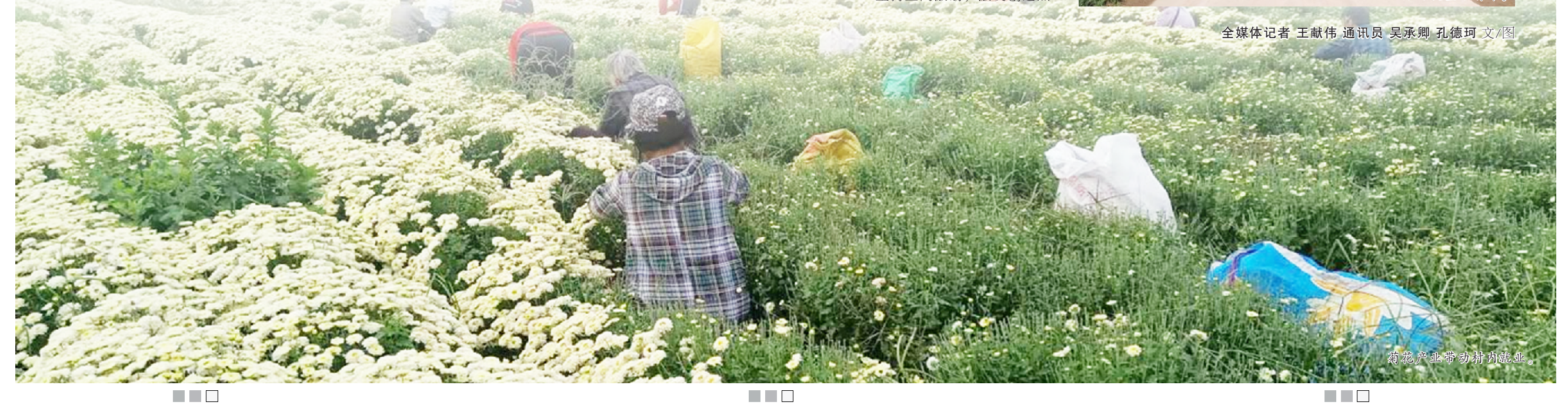
菊花产业带动村内就业。