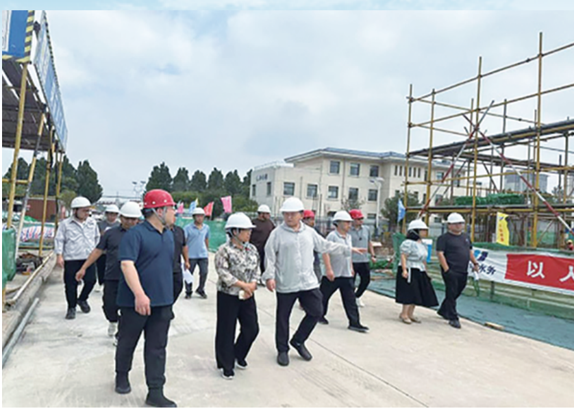
县人大专题调研民生实事进展情况。

为全力保障民生实事项目落实落地,濮阳县雷厉风行抓落实,积极构建县委、人大、政府和人大代表四方联动的跟踪督办工作机制,推动民生实事