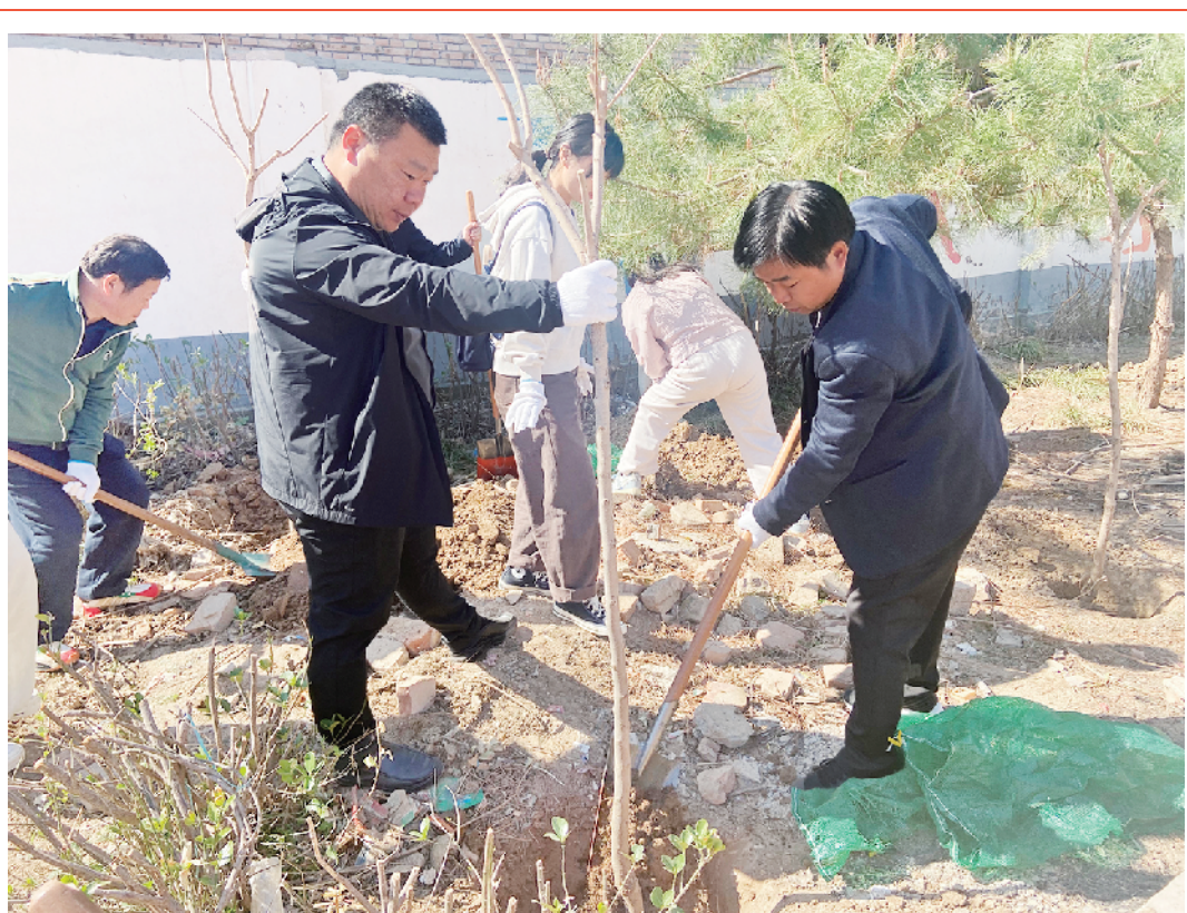
3月21日,市人大常委会机关组织志愿者到濮阳习城乡小甘露村开展“履行植树义务 共建美丽河南”文明实践志愿服务。⑩